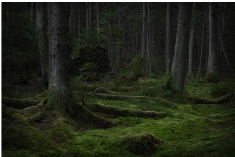
Fig. 2. Thick forest

An old growth forest that is dense, does not let in sun and wind and can be dark or thick (Fig. 2).