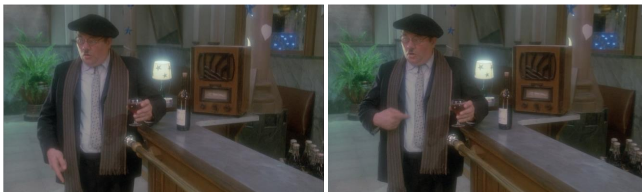
Fig. 3. A drunkard "revealing" the etymology of words (Le Bal, Ettore Scola, 1983)

Etymologists, who randomly take any Russian word and deduce its inevitable borrowing from any existing or invented languages, are reminiscent of a MUMBLING drunkard, talking to himself and unsuccessfully proving something to the unknown or to himself with incomprehensible muttering and expressive gesticulating (Fig. 3).