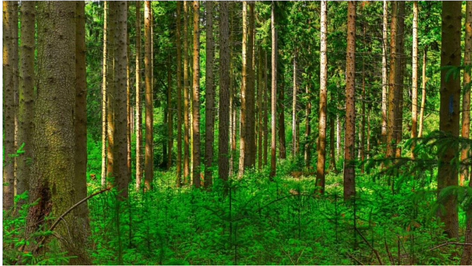
Рис. 1. Лесной БОР

Старый лес, плотность которого велика, не пропускает солнца и ветра и может быть ТЕМНЫМ или ГЛУХИМ Рис. 2.