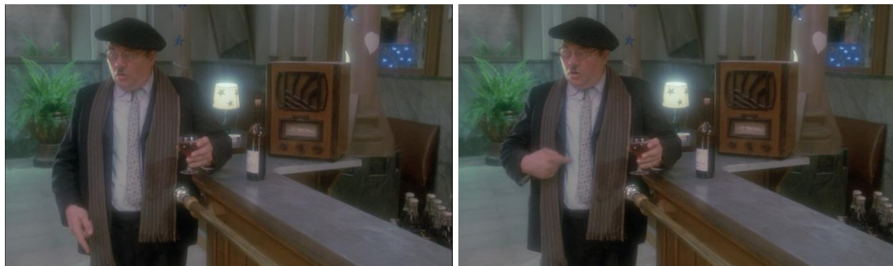
Рис. 3. Пьяница «раскрывающий» этимологию слов («Бал», Этторе Скола, 1983)

Отсюда также и БОРМОТУХА – спиртное низкого качества, позволяющее алкоголикам вести бесконечные словесные баталии с несуществующим собеседником.