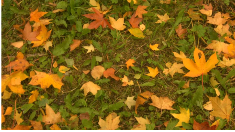
Fig. 4. Alfred Schnittke. AUTUMN (elegy) https://www.youtube.com/watch?v=-OjvG4Bmn68