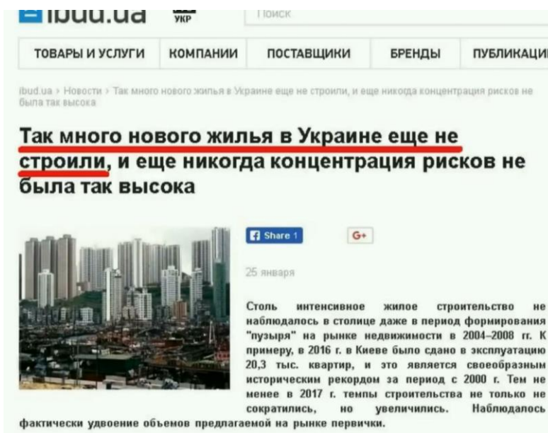
Рис. 2. Необъяснимо бурный объем строительства в разгар тотального кризиса

Именно в этом, видимо, заключается постмайданная подготовка с предварительной очисткой территории от местного населения посредством голода, холода и войны. Теперь появились уже и дополнительные признаки в виде сообщения о разворачивании бурного строительства новых высотных зданий в Киеве Рис. 2.