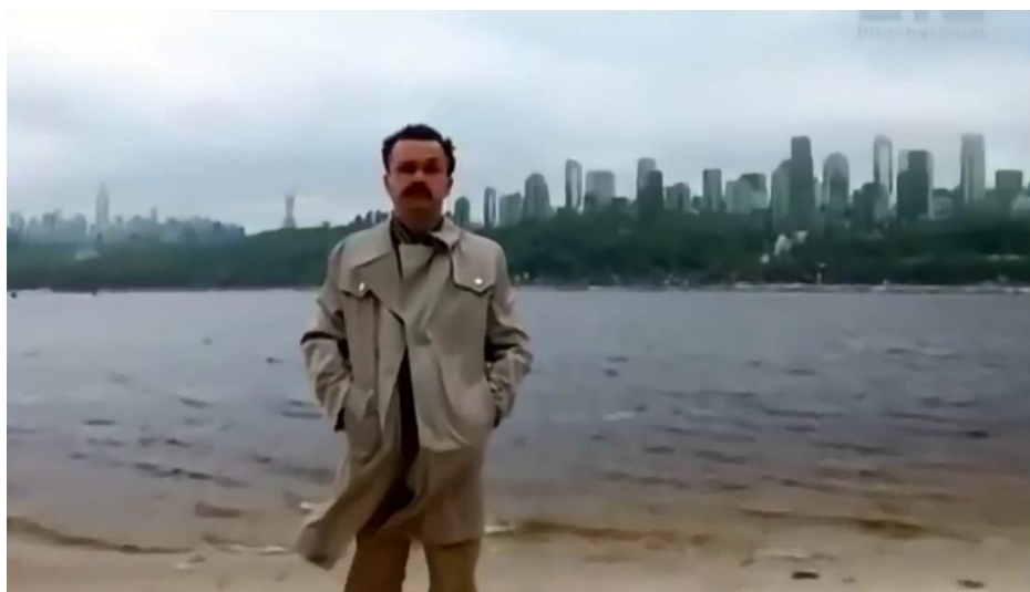
Fig. 1. Photo of Kyiv of the future with skyscrapers

In my understanding of physics, introduced by the article 'The Definition of Time' ( http://viXra.org/pdf/1808.0598v1.pdf ), such movements are not possible , except in a thin body. It is unclear where the dense body is supposed to go. But that is not the point. There is a picture of Kyiv from the future , already built up with skyscrapers (Fig. 1).