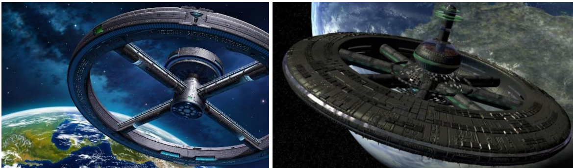
Рис. 1. Гипотетические космические станции будущего

В научно-фантастических романах постоянно изображаются космические станции будущего в виде огромных тороидов, вращающихся для создания в них этой центробежной силы Рис. 1 – 2.