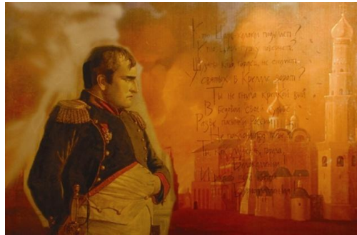
Рис. 4. Сожжение МОСКВЫ Наполеоном