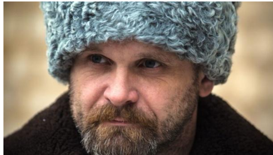
Рис. 8. Герой Донбасса Алексей Мозговой – МОСКОВСКИЙ.

И пока МОСКВА остается МОЗГОМ, сердце России – Донбасс не победить. Кстати, фамилия Мозговой тоже означает МОСКОВСКИЙ (Рис.8).