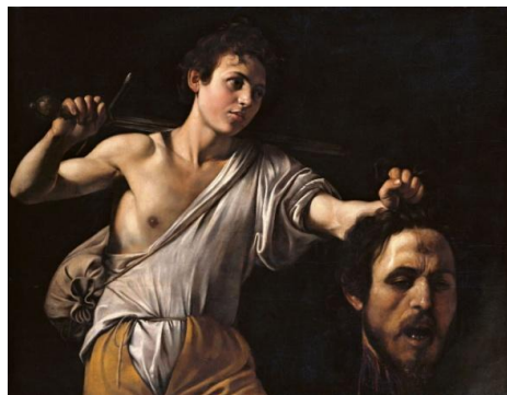
Рис.1. Метафора – маленький Давид поражает могучего Голиафа ударом в МОЗГ

Понятно, что уничтожение России должно начинаться с поражения ее МОЗГА (рис. 2 – 7).