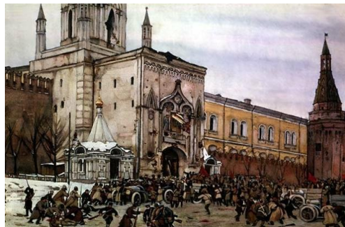
Рис. 5. Разгром Кремля большевиками 15 ноября 1917 года