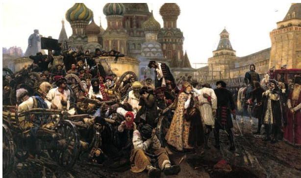
Рис. 3. Захват МОСКВЫ лжецарем Петром