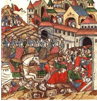
Рис.2. Сожжение МОСКВЫ Тохтамышем