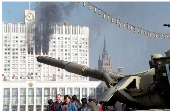
Рис.7. 1993 год. Лицо демократии в МОСКВЕ

И пока МОСКВА остается МОЗГОМ, сердце России – Донбасс не победить. Кстати, фамилия Мозговой тоже означает МОСКОВСКИЙ (Рис.8).