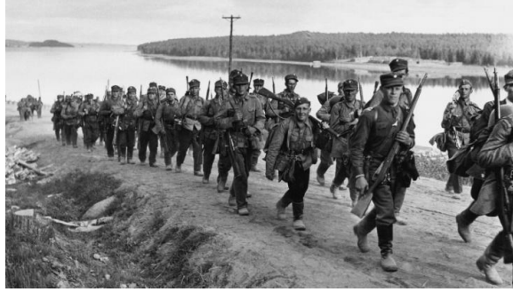
Рис.6. 1941 год. Немцы уже видят в бинокль пригороды МОСКВЫ