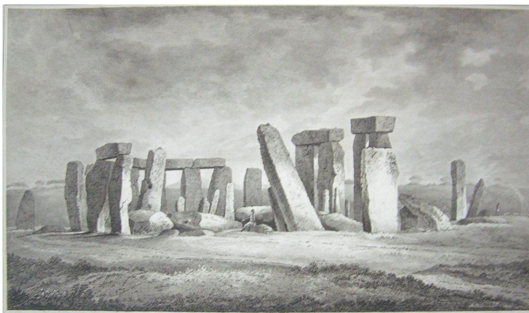
Рис. 4. Западный вид Стоунхенджа. Рисунок

А начинал все это еще сам Ньютон, благо он мог распоряжаться деньгами казначейства.