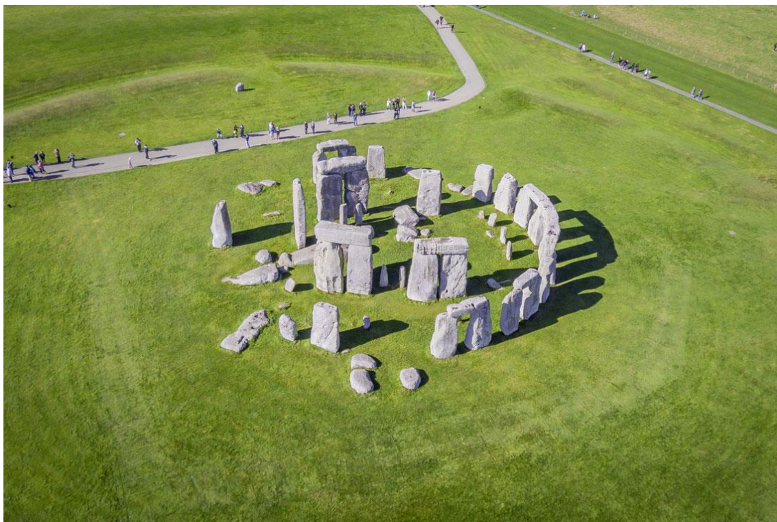
Рис. 1. Стоунхендж. Общий вид

На новогоднем «корпоративе», включающем принятие известных напитков и беспредметную болтовню, выслушал сообщение о поездке в Оксфорд и попутных впечатлениях, включающих посещение Стоунхенджа Рис. 1.