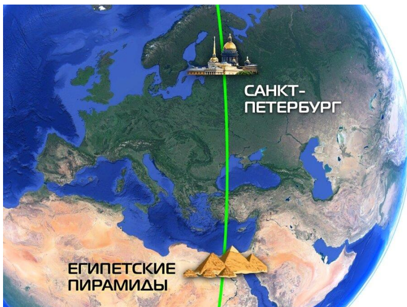
Рис. 5. Исходный нулевой меридиан. Называемый также Пулковским или Александрийским

А почему Запад? По отношению к чему это Запад? Ответ простой – по отношению к НУЛЕВОМУ меридиану Рис. 5.