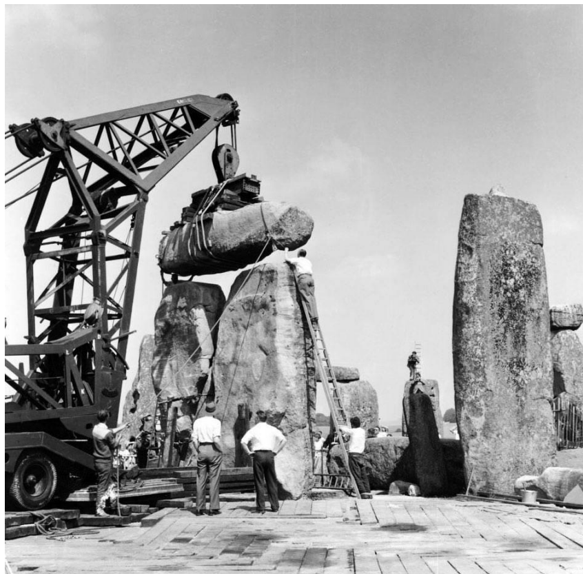
Рис. 3. Другой этап «реконструкции».

А начинал все это еще сам Ньютон, благо он мог распоряжаться деньгами казначейства.