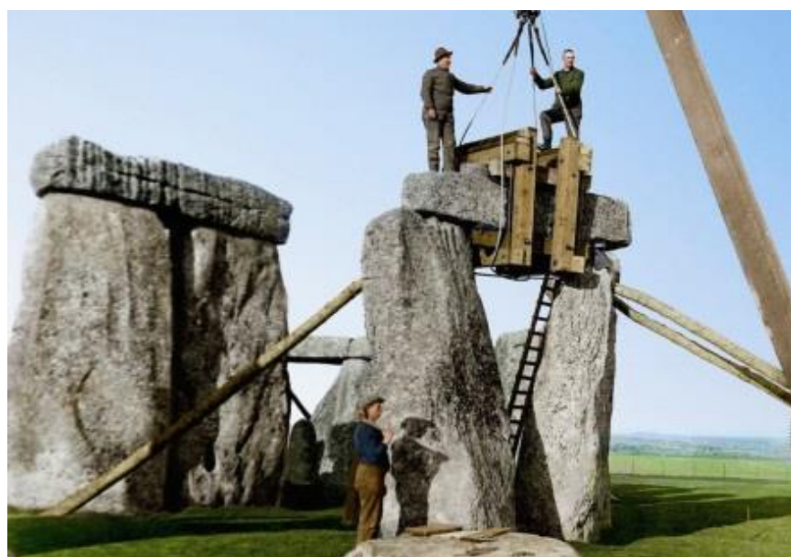
Рис. 2. «Реконструкция» Стоунхенджа

Сооружения «3000-летней давности», которое строили в 1908, 1928 и 1952-1956 годах. О чем имеется множество превосходных фотографий.